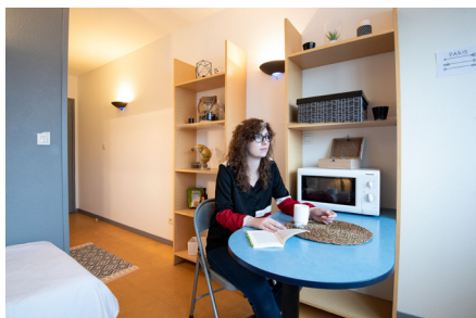
241 avenue Général de Gaulle 69500 Bron