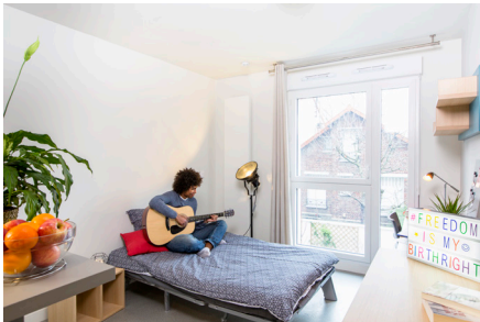
341 rue Estienne d'Orves 92700 Colombes