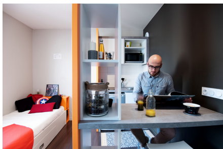
18 rue Marc Bloch 69007 Lyon