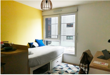
55 Avenue René Cassin 69009 Lyon