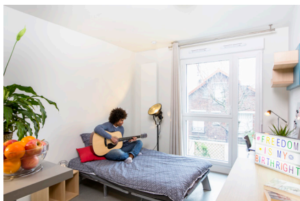
341 rue Estienne d'Orves 92700 Colombes