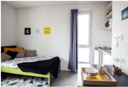
279 Avenue Berthelot 69008 LYON