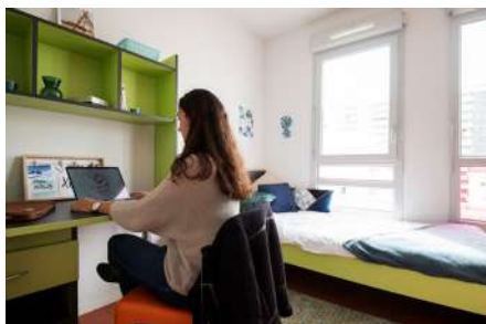
10 rue Jacqueline Auriol 69008 Lyon